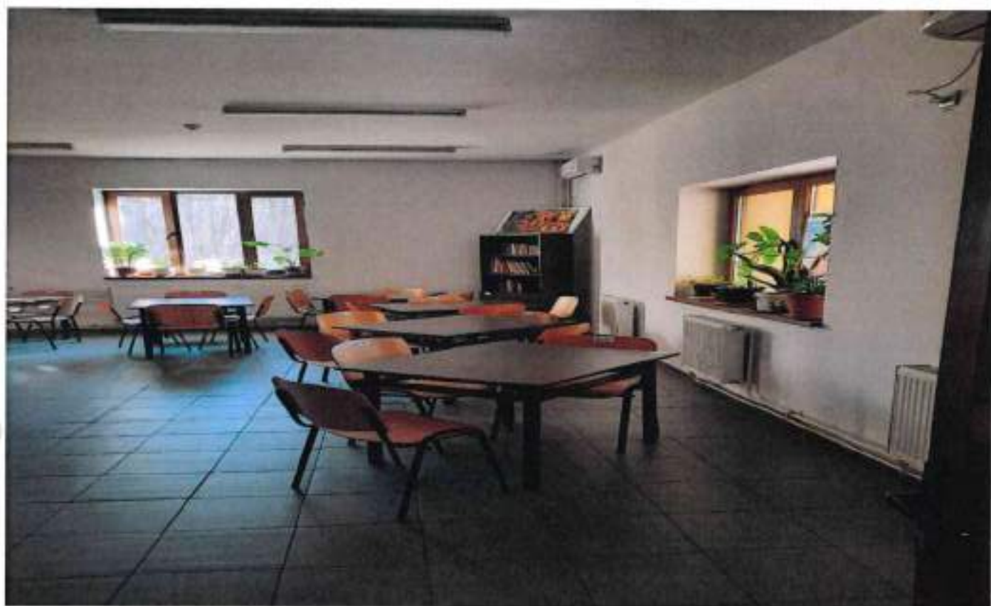
Spatii de locuit