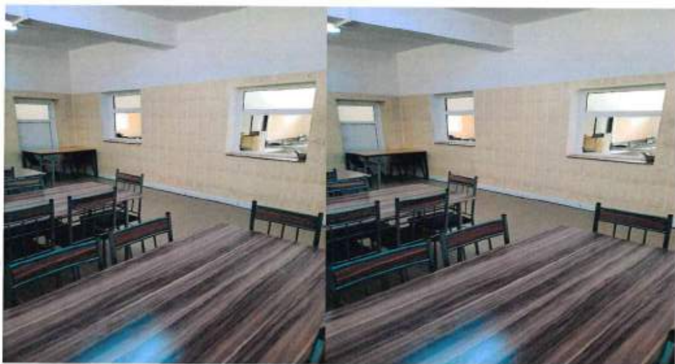
Spatii de socializare